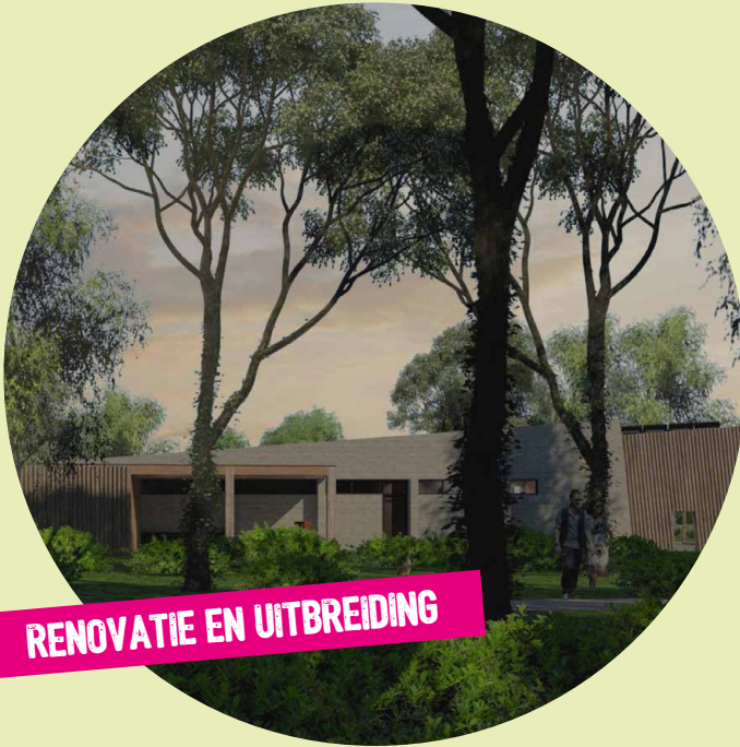
RENOVATIE EN UITBREIDING

VANUIT HET BELEIDSPLAN 'SAMEN DUURZAAM DENKEN EN DOEN 2021-2025' IS OOK DIT JAAR GEWERKT AAN DE REALISATIE VAN ONDERSTAANDE SPEERPUNTEN.