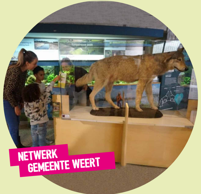
NETWERK GEMEENTE WEERT