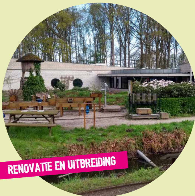
RENOVATIE EN UITBREIDING

VANUIT HET BELEIDSPLAN 'SAMEN DUURZAAM DENKEN EN DOEN 2021-2025' IS OOK DIT JAAR GEWERKT AAN DE REALISATIE VAN ONDERSTAANDE SPEERPUNTEN.