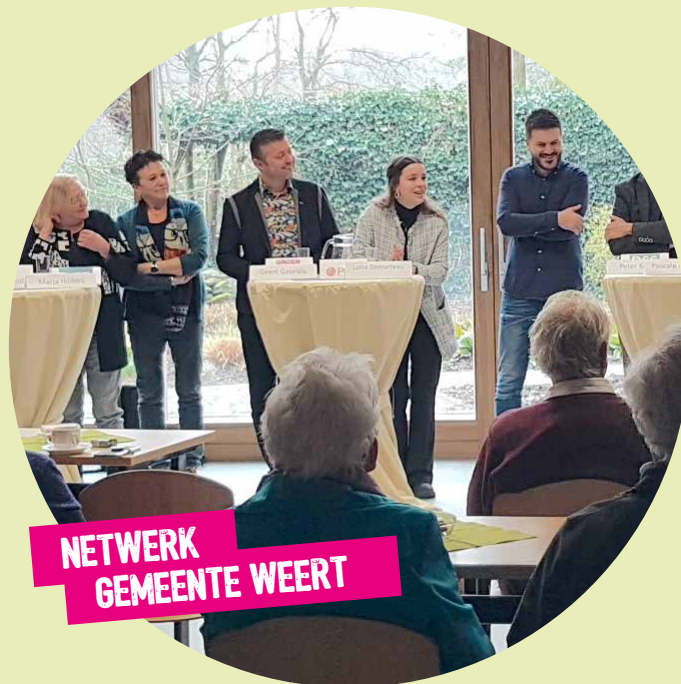
NETWERK GEMEENTE WEERT